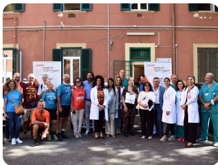
Il personale all'arrivo della delegazione di CiaoChiara

IL PRELIEVO DEI TESSUTI. Un pool di 7 medici oculisti è responsabile dei prelievi dei tessuti sclero corneali.