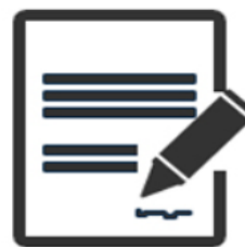
Dichiarazione con data e firma